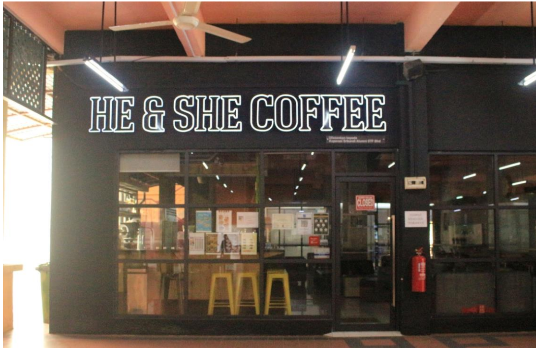
Kafeteria HE & SHE COFFEE